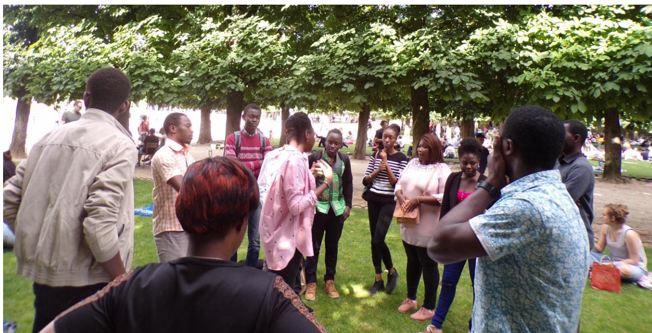
Photos de l'AG du MROD/BF section France