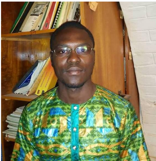
Aristide S.S-T DAH

« Les gens de Dubaï, les Indiens et les Chinois ne nous disent pas que nous ne sommes pas entrés dans l'histoire, ils commercent avec nous », tel étaient les propos de Lionel ZINSOU ancien Premier Ministre du Bénin dans la parution du quotidien le Monde du 30 septembre 2007. Au lendemain de la colonisation qui avait mis le continent africain au-devant de la scène internationale et fait d'elle un objet de convoitise pour les différents Etats impérialistes, l'Afrique est de nouveau sous le feu des projecteurs avec l'arrivée des puissances émergentes à l'instar de la Chine qui multiplie les efforts pour asseoir son aura diplomatique et économique dans une Afrique « délaissée » par ses anciens alliés.