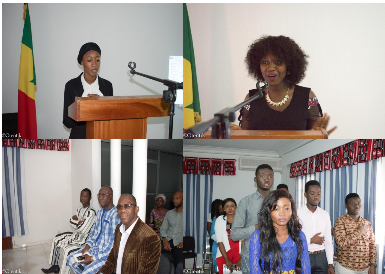
Photos du lancement des activités du MROD/BF section Sénégal